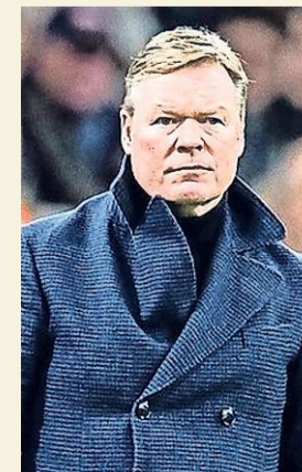
Ronald Koeman

Als geen ander beseft Jasper Cillessen dat Ronald Koeman door het oog van de naald is gekropen, nadat die hartproblemen kreeg. „Een of twee dagen daarvoor liep het bij een bekende van ons niet goed af. Hij was iets jonger dan mijn ouders, de trainer van mijn neef, die in het bos ging mountainbiken en dat helaas niet kan naverellen. Pluk de dag”, aldus Cillessen die net als veel andere internationals een whatsappbericht naar Koeman stuurde om hem sterkte en succes bij zijn herstel te wensen.