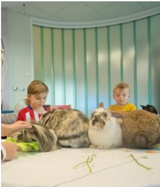
Soms komen vrijwilligers langs je bed met dieren van de kinderboerderij

In het ziekenhuis zijn een heleboel vrijwilligers. Dat zijn mensen die soms in het ziekenhuis werken, maar er geen geld voor krijgen. Ze doen het omdat ze het leuk vinden om iets voor de patiënten te doen. Ze zijn onmisbaar!